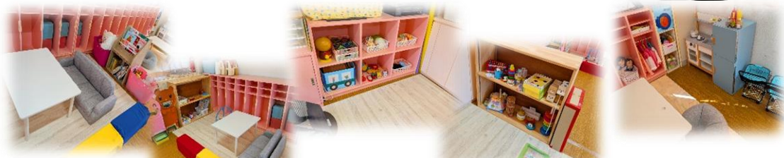
絵本を読んだり座って遊べるコーナーです。 ここは赤ちゃんでも遊べる玩具があります。 おままごともありますよ~♪

===== 聖母幼稚園内では、写真撮影をご遠慮 下さい。ご協力宜しくお願いします。 =====